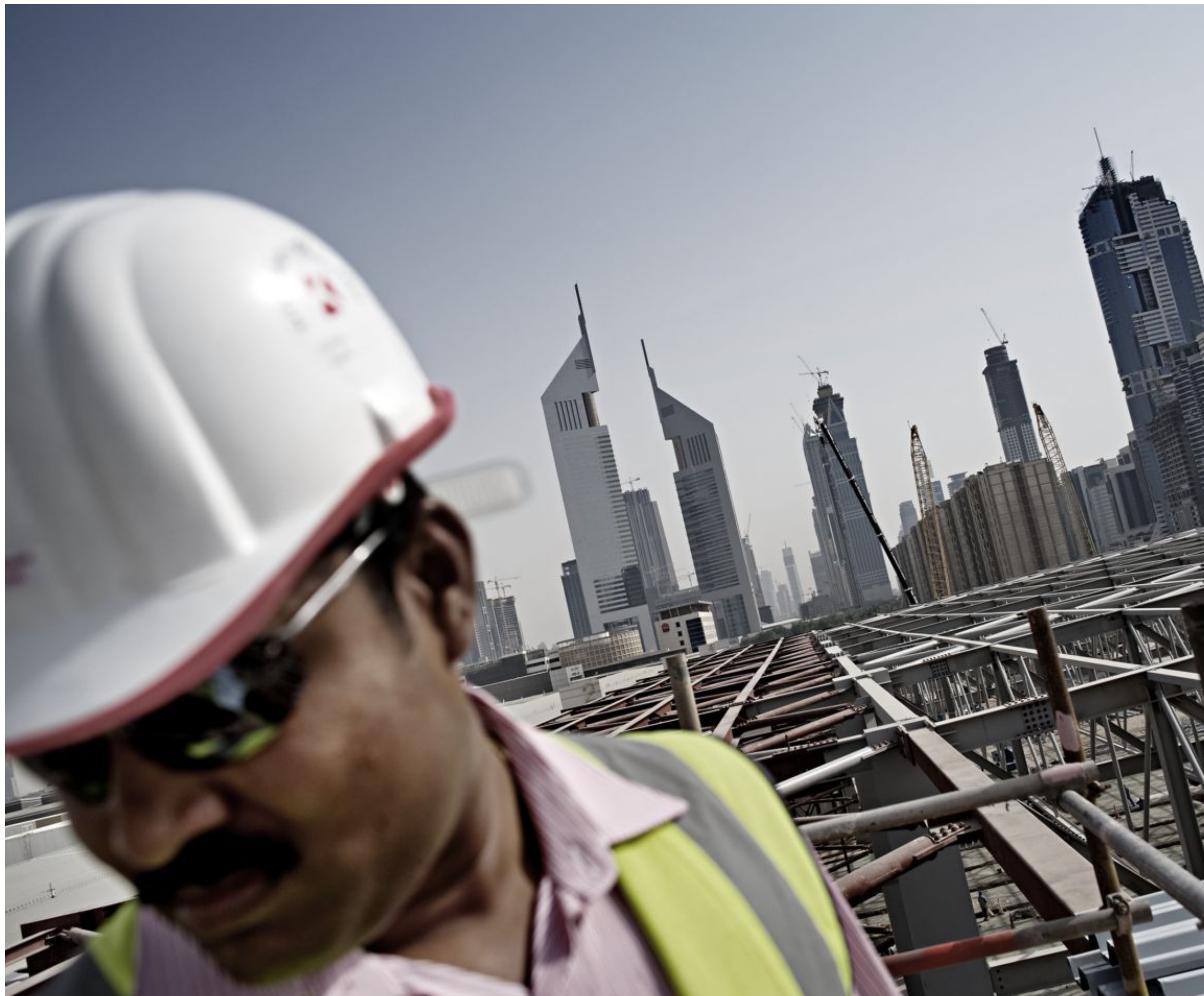
De som byggde Dubai är fattiga gästarbetare från södra Asien. Enligt flera rapporter börjar de nu skickas hem.

Mitt i den globala ekonomiska krisen invigs en rekordskyskrapa i Förenade Arabemiraten. Burj Dubai är högst i världen – och byggd på ett skuldberg. Här bland avsomnade byggkranar finns också en annan berättelse: de arbetslösa och skuldsatta migrantarbetare som byggt staden och som nu skickas hem.