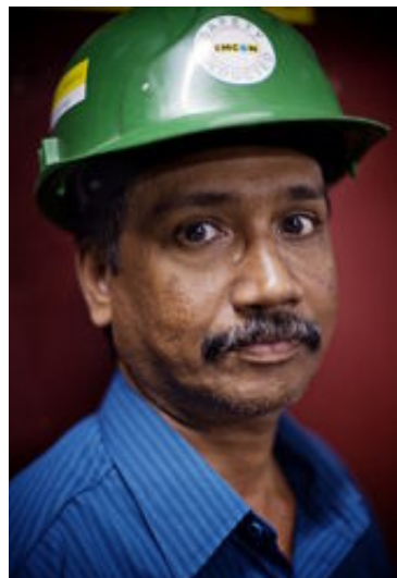
Byggnadsarbetaren Tipi förbereder sig inför kvällens arbetspass.