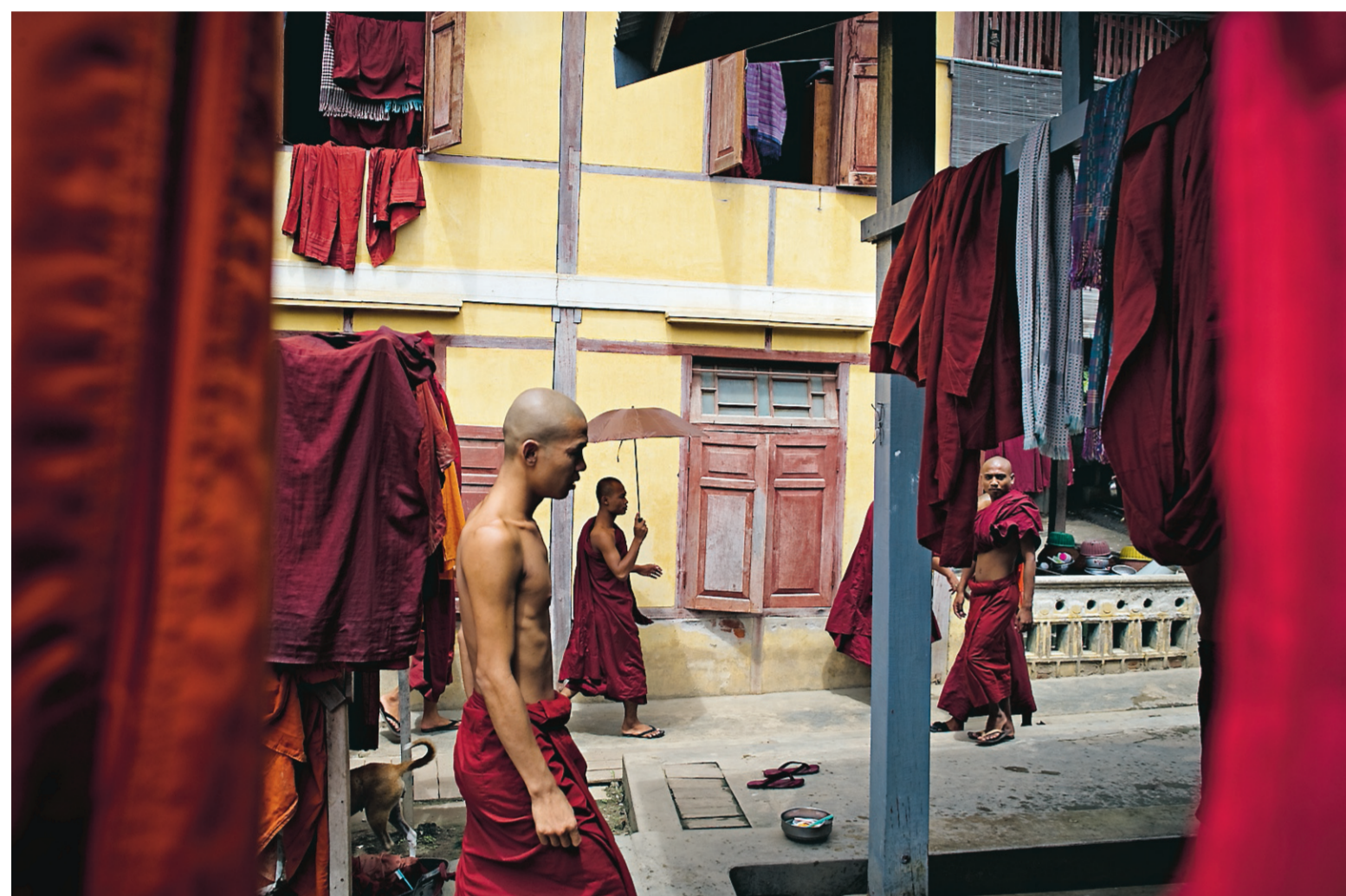
År 2007 blev munkarna världsberömda i ett uppror som medierna döpte till saffransrevolutionen. Protesterna fick stor uppmärksamhet i världens medier, men slogs ner av juntan med våld.