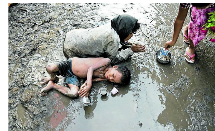
NØD: En kvinne tigger med sitt barn på den gjormete gaten i Mandalay.