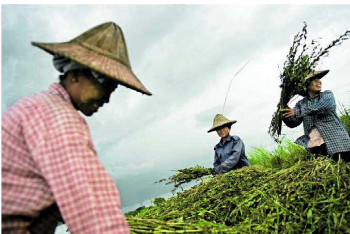
MATAUK: Bønder i arbeid på markene utenfor den nye hovedstaden Naypydaw. Jordbruk er hovednæringen i Burma, 50 prosent av den dyrkede jorden brukes til risproduksjon.

Tekst: MARTIN SCHIBBYE Oversatt og tilrettelagt av: LARS HALVOR MAGERØY