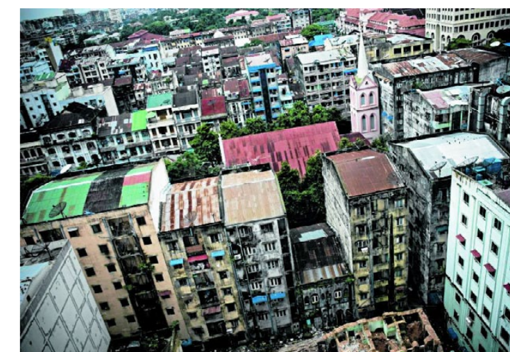
FORFALLENT: Rangoon ble hovedstad i 1753 og er fortsatt landets største, med flere innbyggere enn hele Norge.