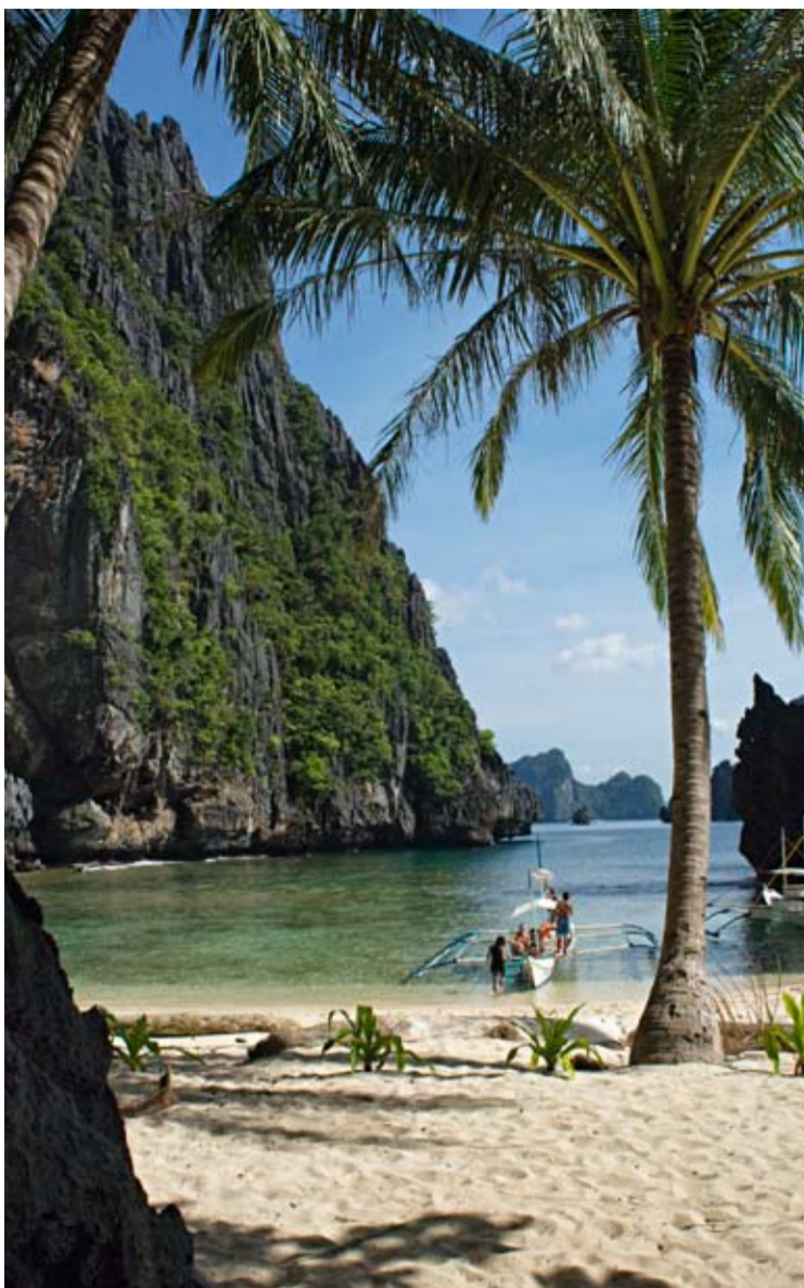
Stora delar av ön Palawan är andlöst vackra.