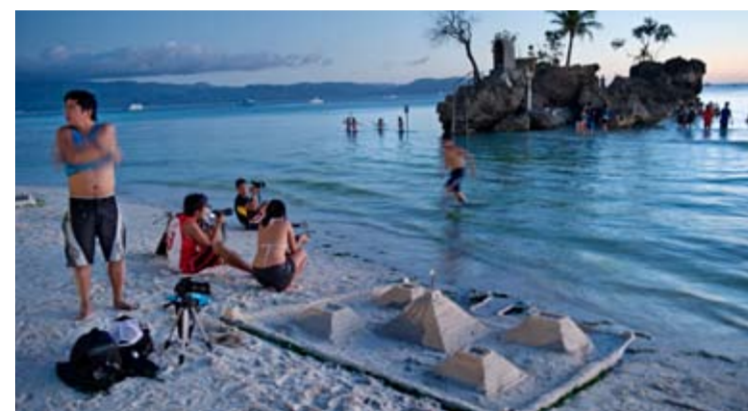
På Boracay är sanden vit och stranden fyra kilometer lång.

spelades dock in i Thailand. Kusten och Bancuit-skärgården är fortfarande till stora delar orörd och fylld med obebodda öar och ödsliga stränder. Under ytan finner du dykning och snorkling i världsklass. » www.palawan.com » www.palawan.gov.ph