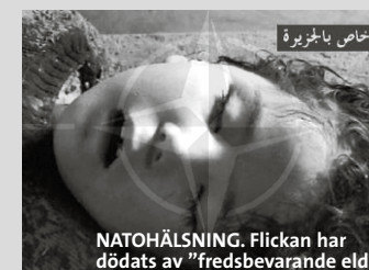
NATOHÄLSNING. Flickan har döts av "fredsbevarande eld".

Den "Nato-ledda internationella styrkan" i Afghanistan medger att den sköt ihjäl alldeles för många civila afghaner under 2006, rapporterar Ekot. Nato påstår att man den senaste tiden "sett över sina rutiner för att komma fram till hur antalet civila dödsoffer ska kunna minskas". Natosoldaterna anklagades bland annat för att förra året ha dödat ett tiotal civila i flygangrepp, under strider och när soldater som känt sig hotade öppnat eld. Till och med den annars så västtillvände presidenten Hamid Karzai har värdjat till de utländska trupperna "att visa större återhållsamhet" efter att två civila döts av Natosoldater. Hur stort mörkertalet verkar ingen vilja spekulera i.