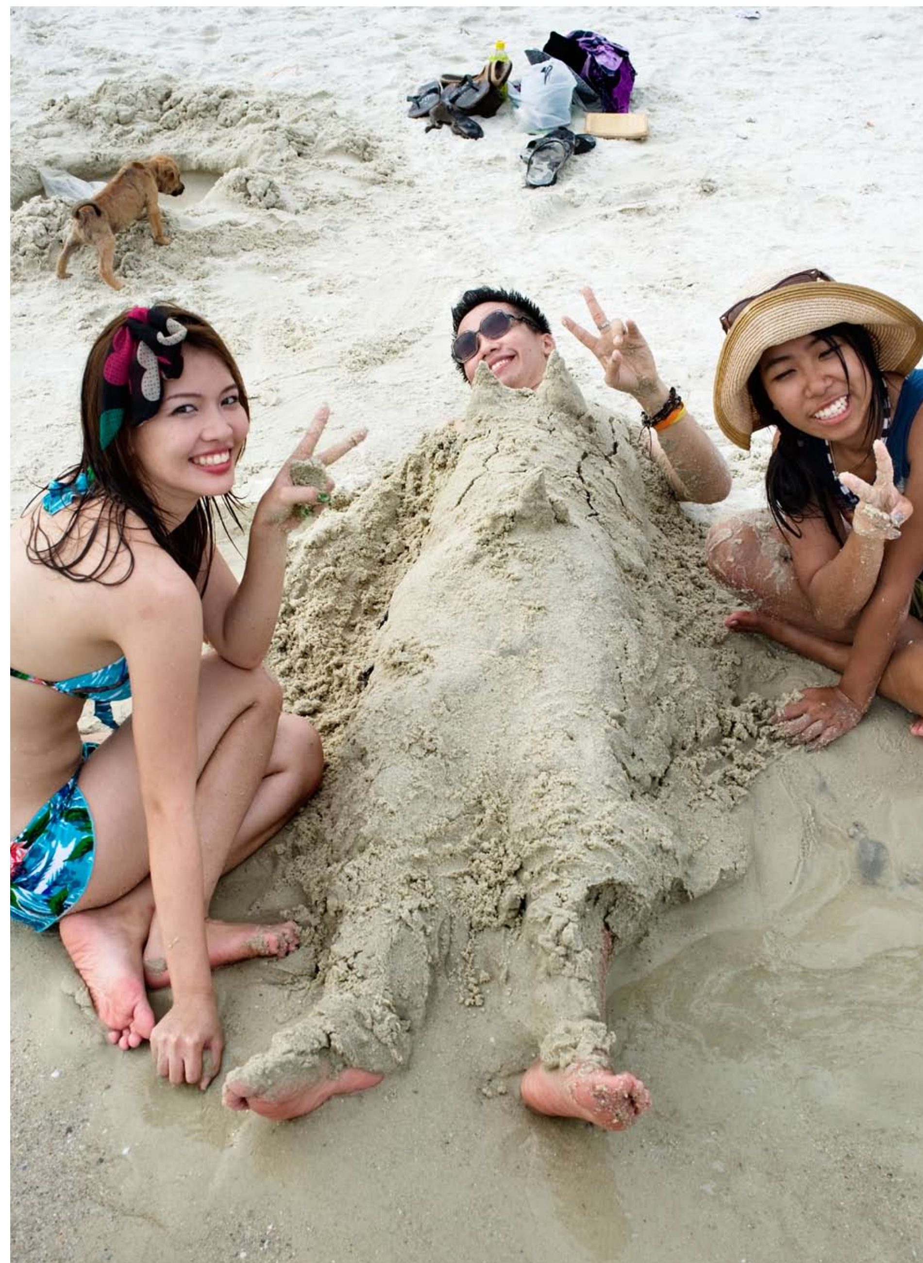
Med anstormningen av nya kinesiska turister följer en del kulturkrockar. I asiatisk press har man kunnat läsa om att de på kort tid blivit ökända för att vara högljuda och ha dåligt bordsskick. När skrivrierna nådde Beijing drog regimen igång en nationell kampanj för att låra ut turistvett.

Fakta häv utan indrag. Fakta brödtext utan indrag. Del sid xx