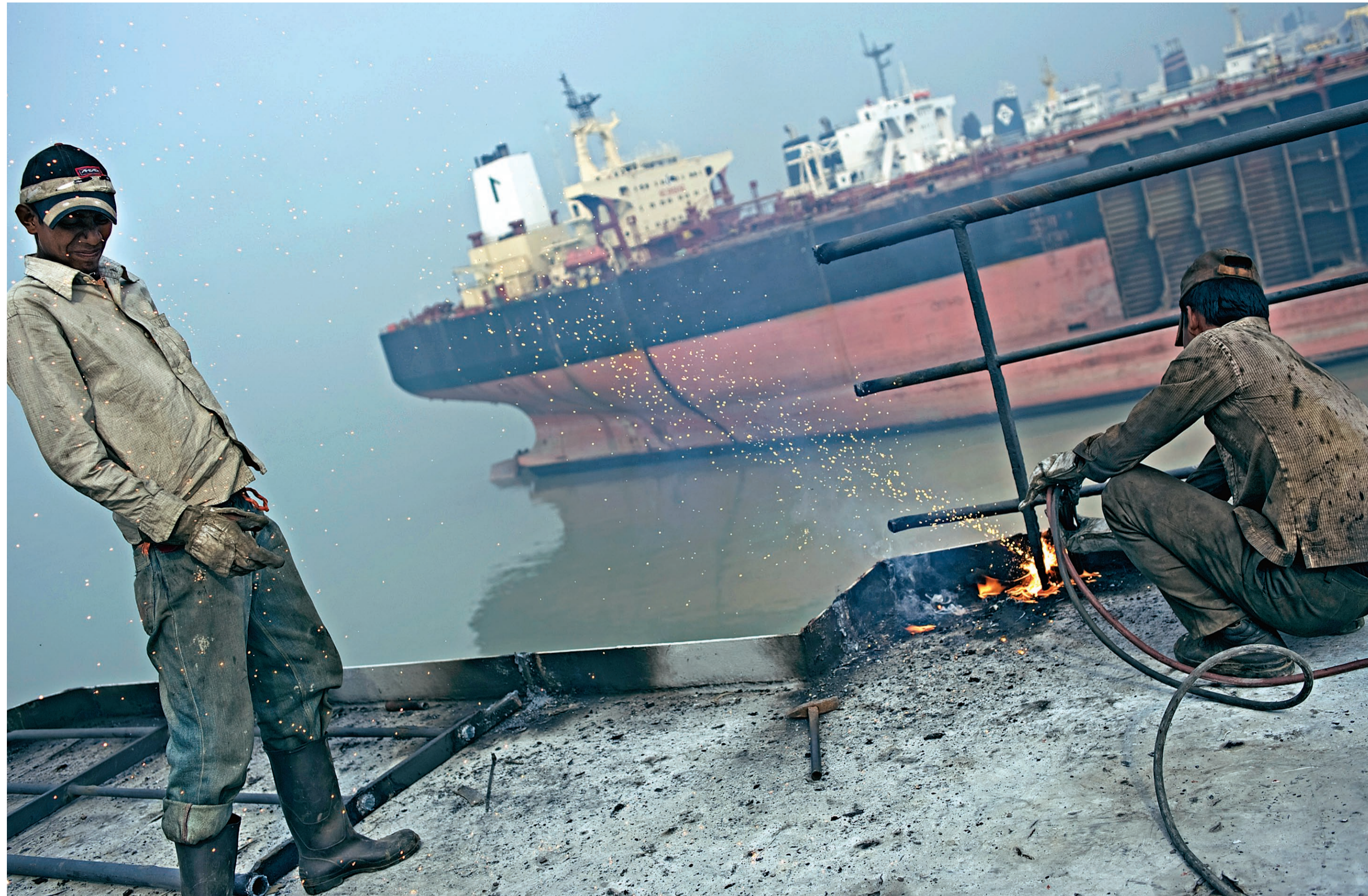
TEMAORD TILL PUNKT. Bildtext och därefter cmd-SHIFT-N, sedan kommer. FOTOGRAFER

ILO-rapport: www.ilo.org/public/english/dialogue/sector/papers/shpbreak/Aven_skeppsregistret Lloyds har publicerat riktlinjer för hur miljöfarliga ämnen ska redovisas och klassningssällskapet det Norska Veritas har i en rapport mätt gifthalter i leran.